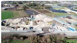
第二浦田 リサイクル処理施設