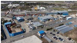
第三平和総合 リサイクルセンター