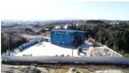
第四野田無機性 汚泥造粒固化処理施設