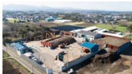
第一上水流 リサイクル処理施設